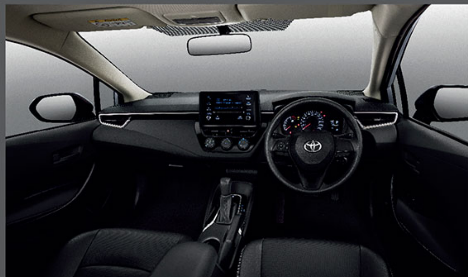
เบาะหนังสีดำ